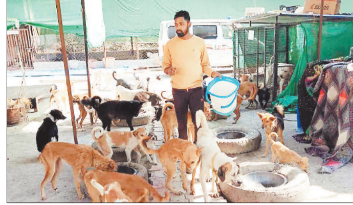
शेल्टर में घुमंतू डॉग्स को भोजन देते टीम के सदस्य।