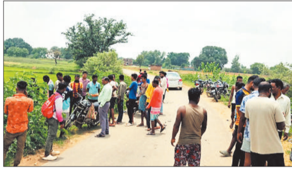
दुर्घटना के बाद लमी लोगों की भीड़।

बताया जा रहा है कि तेज रफ्तार में आ रही बाइक ने सामने से आ रही स्कूटी को जबरदस्त टक्कर मार दी। हादसे में स्कूटी के परखच्चे उड़ गए और दोनों सवार सड़क किनारे जा गिरे।