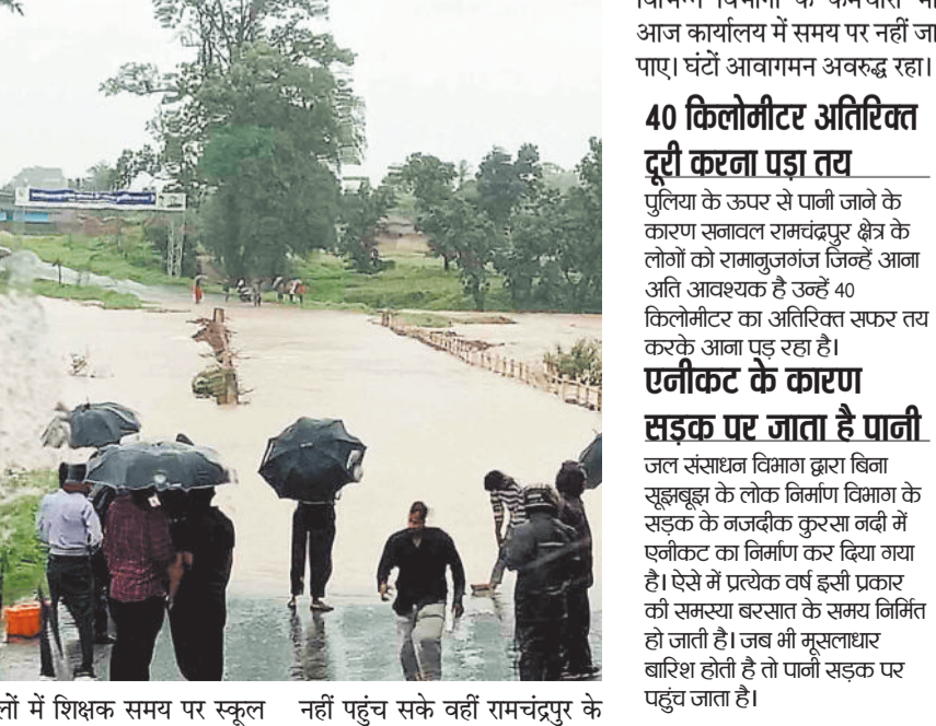
स्कूलों में शिक्षक समय पर स्कूल नहीं पहुंच सके वहीं रामचंद्रपुर के

लगातार हो रही मूसलाधार बारिश से रामानुजगंज लुरगी से सनावल मुख्य मार्ग रामचंद्रपुर के पीछे कलिकापुर कुरसा नदी में का पानी पुल के ऊपर आ गया जिससे दोनों ओर सुबह 8.30 बजे से आगमन अवरुद्ध हो गया। दोनों ओर घण्टों आवगमन अवरुद्ध रहा। गौरतलब है कि रामानुजगंज लुरगी रामचंद्रपुर सनावल मुख्य मार्ग में बड़ी संख्या में लोग प्रतिदिन आना जाना करते हैं। रामचंद्रपुर में विभिन्न विभागों के कार्यालय संचालित है। यह मुख्य मार्ग है जहां आज सुबह 8.30 बजे से कुरसा नदी पुलिया के ऊपर से पानी जाने लगा जिससे आवागमन अवरुद्ध हो गया। पुलिया के दोनों ओर बड़ी संख्या में लोग एकत्रित हैं जो पानी कम होने का इंतजार कर रहे हैं। कई